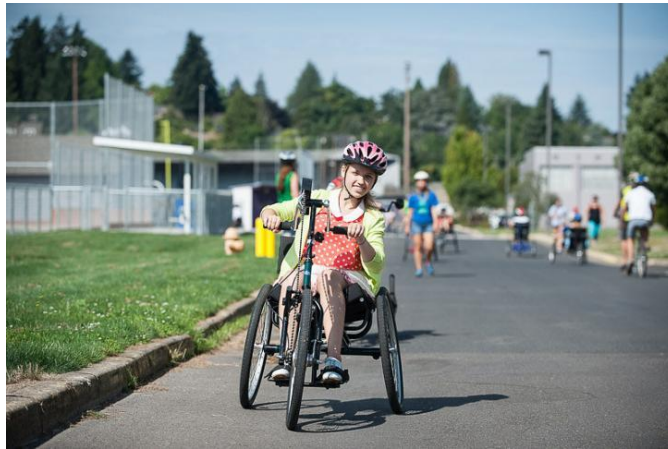
Mujer joven con discapacidad disfruta de ciclismo adaptativo

Las leyes para prevenir la discriminación no deben de estar definidas únicamente en términos de un diagnóstico médico.