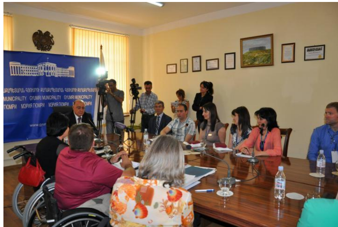
El alcalde de Gyumri, Armenia en reunión con defensores de derechos de personas con discapacidades en 2014.

Políticos de alto nivel y personas influyentes pueden actuar como paladines determinantes para tu causa.