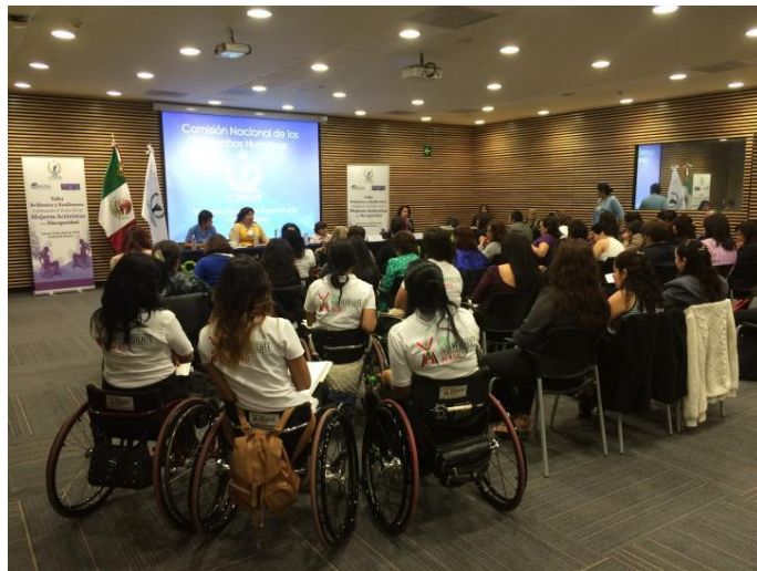
Conferencia en México con público con y sin discapacidades.

Las personas con discapacidad tienen derecho a participar en una amplia gama de actividades, libres de discriminación de cualquier organización, empresa o entidad que proporcione bienes o servicios.