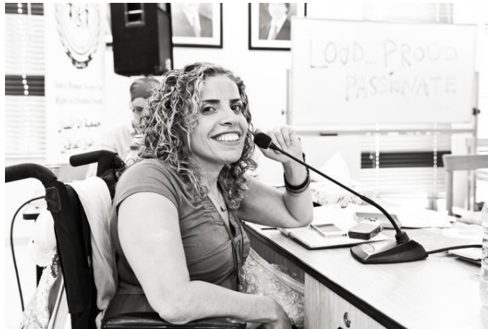
Mujer activista con discapacidad de Jordania

Son las mismas personas con discapacidad quienes juegan un papel determinante al hacer que las leyes se conozcan, se implementen y se apliquen.